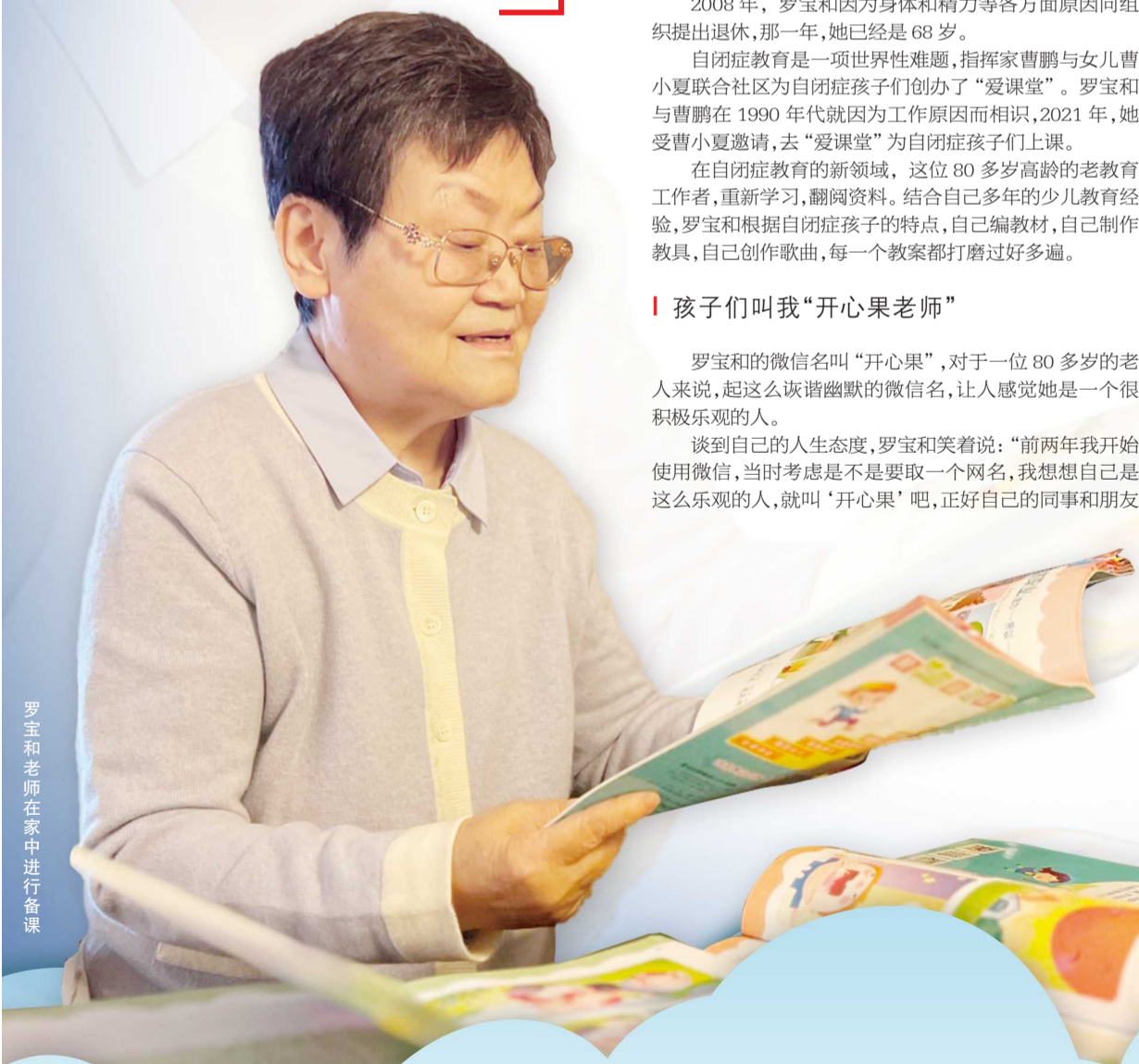
罗宝和老师在家中准备上课