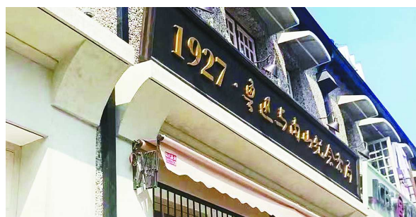
1927·鲁迅与内山纪念书局外景