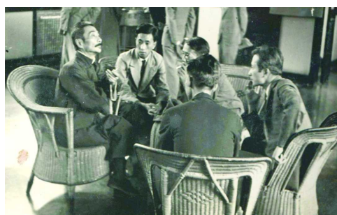
沙飞赠与鹿地亘的鲁迅与青年版画家原版照片