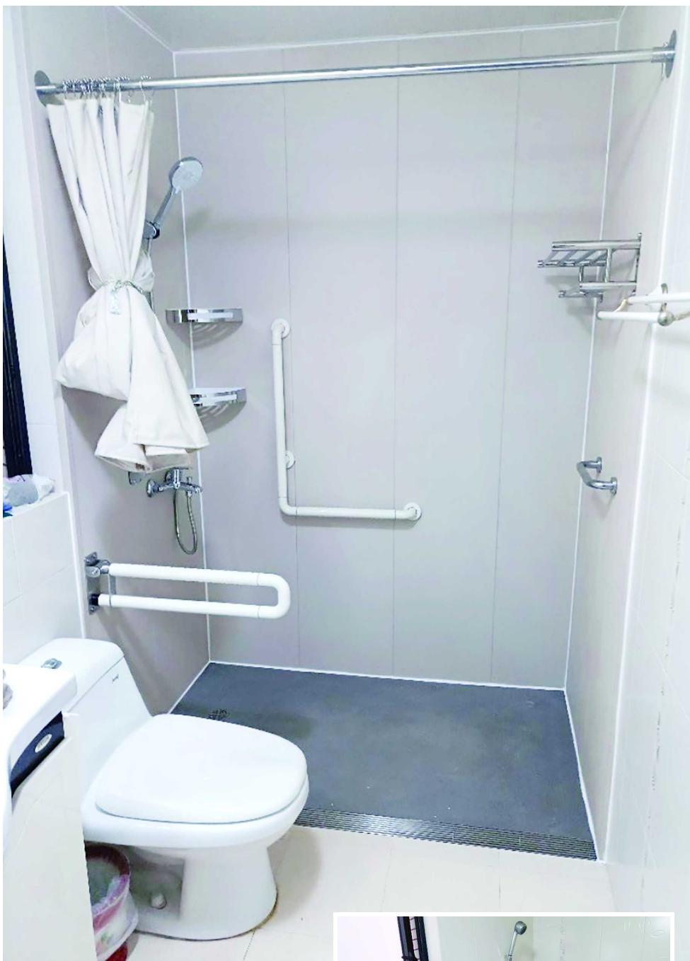
谢莉莉家的浴室改造前后对比