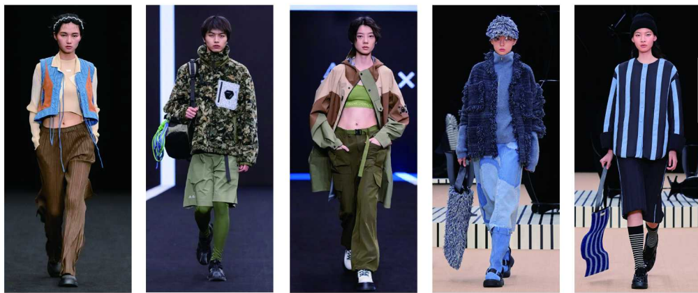
(左1) Bibilee Studio (左2、左3) TRICKCOO (右2、右3) 夹生