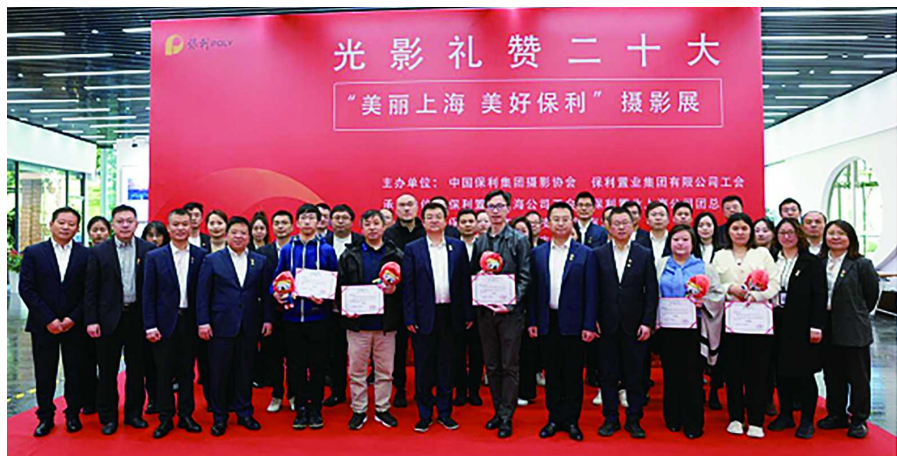
活动中，在与会人员的共同见证下，中国保利集团、保利置业及保利置业集团（上海）投资有限公司有关参会领导为获奖代表颁发证书。

自2021年11月摄影活动启动征集以来，得到广大保利员工及社会各界摄影爱好者的广泛关注。经过近1年的征稿，共收到3万多幅投稿作品。经过线上投票及线下专家评审，最终评选出一等奖2名、二等奖4名、三等奖6名及优秀奖88名，总计100幅作品。（孙鑫）