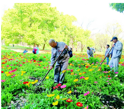
园林工人在修复花海