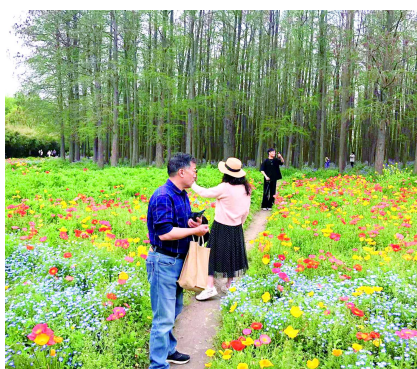
花海里其实预留了多条给游客拍照的小径