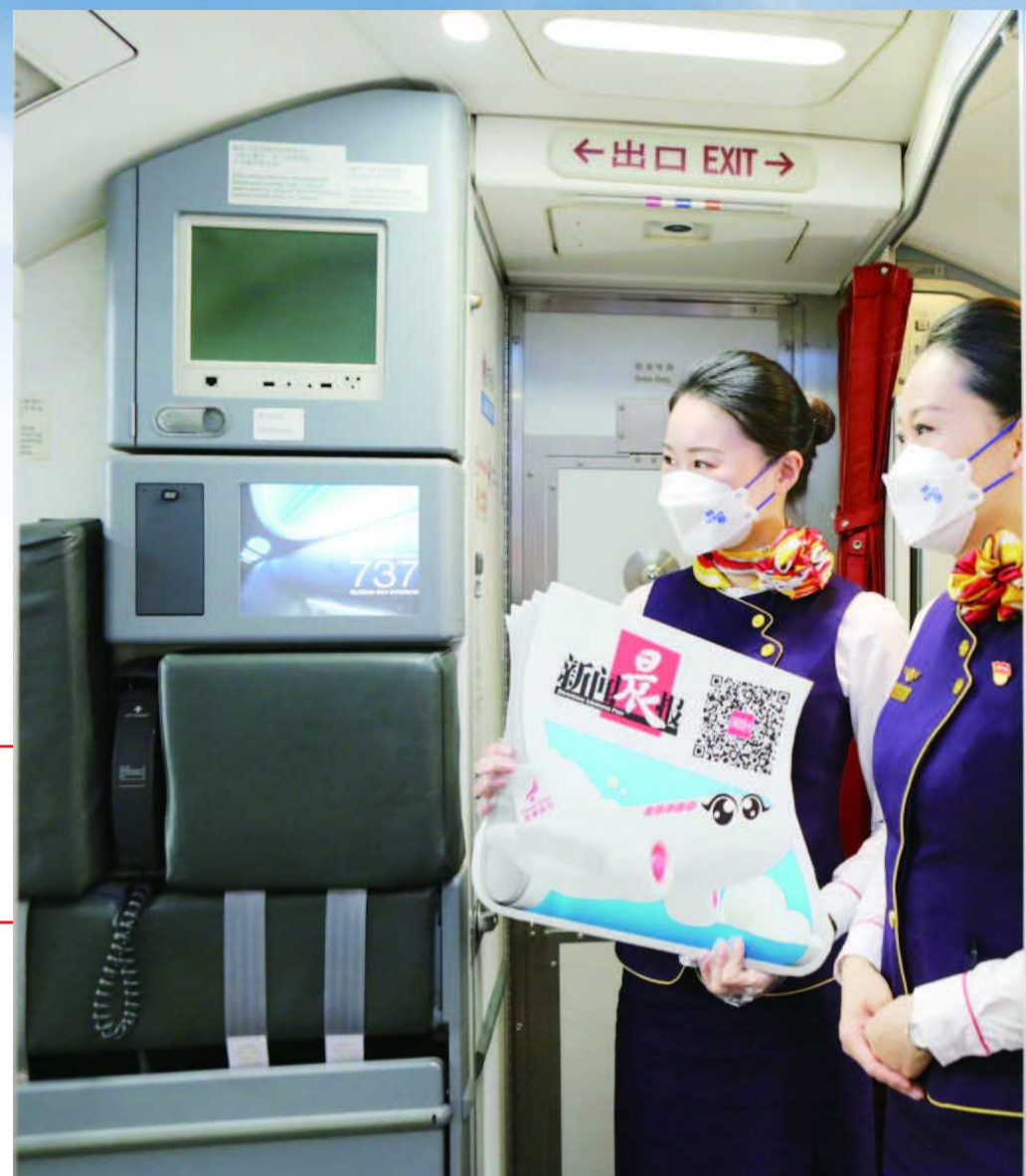
航班上张贴有主题航班的大幅海报