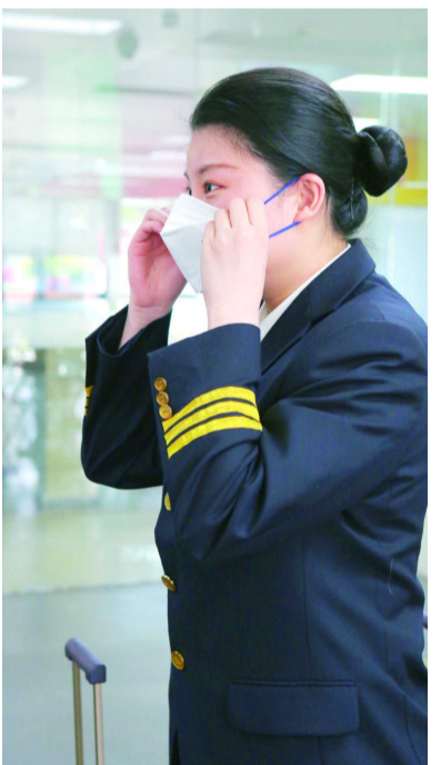
航班女飞行员曾经被晨报报道过

从刚刚毕业的职场新人, 到初为人父再到如今已经成长为经验丰富的业内人士, 新闻晨报在每一个清晨的晨曦中不断见证着这个追梦年轻人的成长。“今天我带着年轻的同事一起来三亚参加公司成立40周年活动, 没有想到还赶上了新闻晨报主题航班, 这份报纸真的是见证了我的成长。”