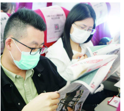
航班上的旅客正在阅读新闻晨报