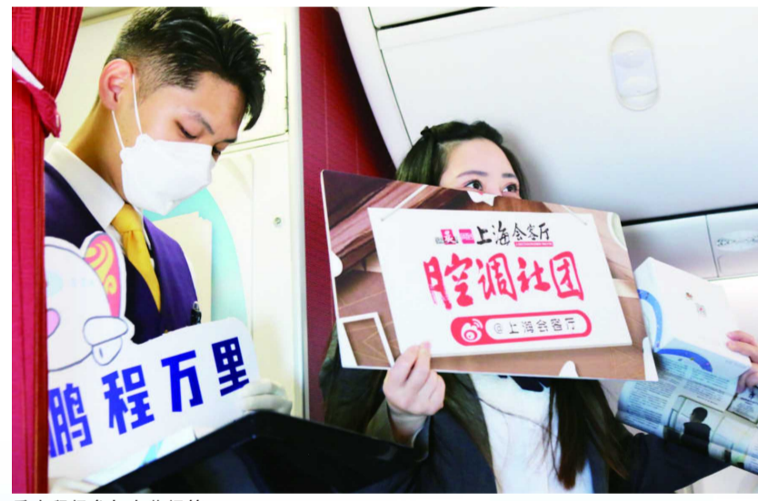
乘客积极参与有奖问答

随后的互动活动设置了有奖问答和故事分享环节, 有奖问答环节设置了5个问题, 答案都藏在旅客方才收到的新闻晨报头版文章里。于是, 在充分阅读之后, 面对乘务长的提问, 大家都争相拼手速。“新闻晨报是哪一天创刊的?” “新闻晨报的客户端叫什么名字?” 这些问题都没有难住旅客, 在对准机舱广播大声喊出正确答案之后, 他们也收到了茶叶作为礼物, 兴奋地向邻座同行的好友展示。