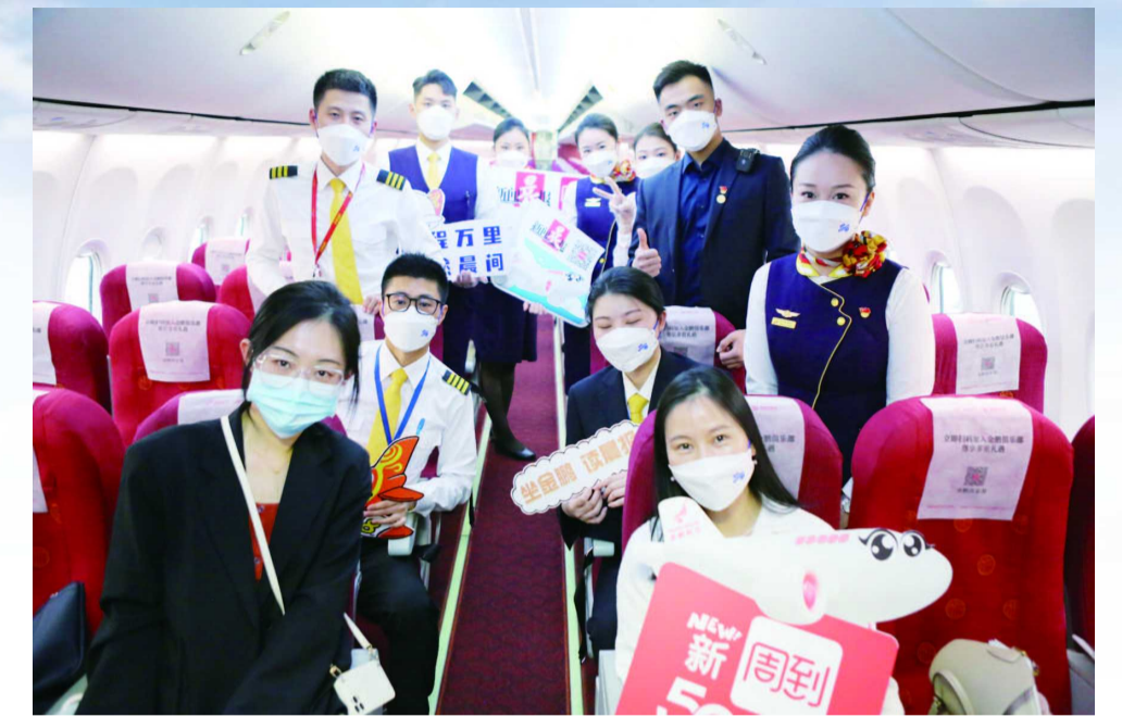
晨报记者与主题航班的乘务人员合影