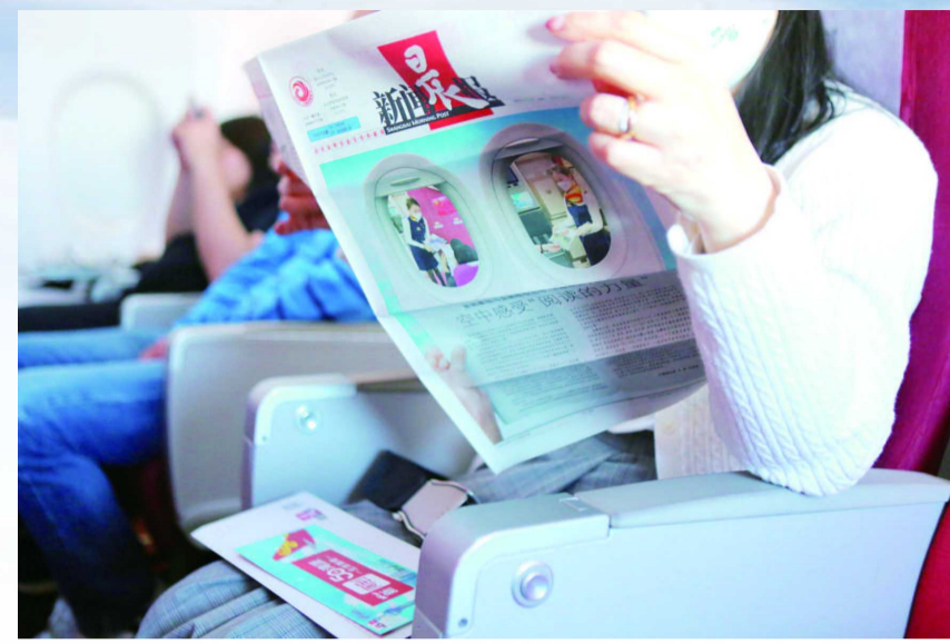
新闻晨报是金鹏航空上的唯一配送媒体