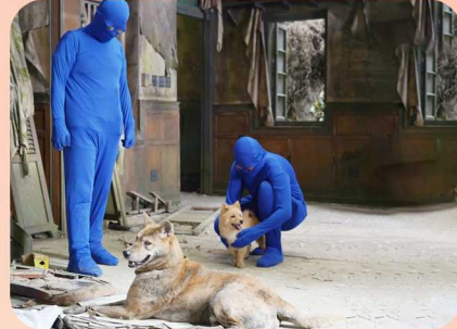
训练师们穿上特殊服装陪伴狗狗拍摄