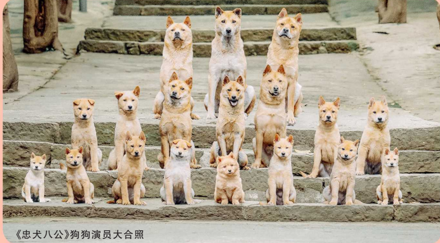
《忠犬八公》狗狗演员大合照

之后几年，大黄跟着我在剧组周转，扮演各式各样的流浪狗。刚开始只是客串，剧组的人会对我说：“放狗的，把狗放那里。”拍了两天之后，就变成了“这狗演得真好，老师，下个镜头这样。”某一次，原本两三天的戏加到了一个月，导演恨不得大黄从客串变成三号主演。最后