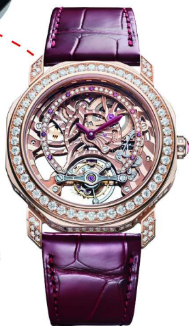
(上) 宝格丽 Octo Roma 系列腕表制作过程