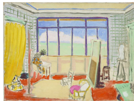
亨利·马蒂斯《在尼斯画室》