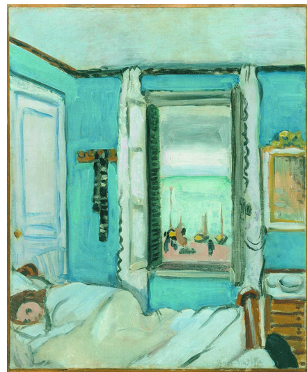
亨利·马蒂斯《室内风景,埃特勒塔》