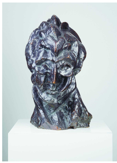
巴勃罗·毕加索《女子头像(费尔南德)》