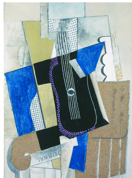
巴勃罗·毕加索《吉他与报纸》