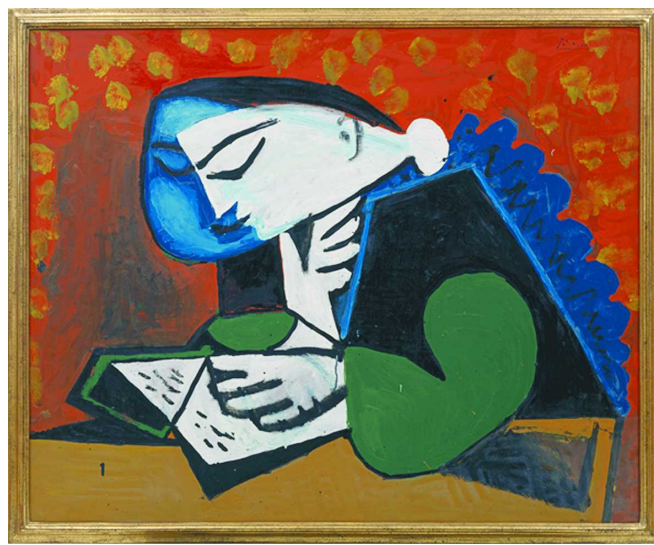
巴勃罗·毕加索《读书的女子》

由上海博物馆的“从波提切利到梵高”开头，今年申城有多场西方绘画艺术大展竞相登场。4月25日，尤伦斯当代艺术中心(UCCA)宣布，与柏林国立博古睿美术馆携手呈现“现代主义漫步：柏林国立博古睿美术馆馆藏展”，展览将率先于6月22日至10月8日在上海UCCA Edge亮相。巴勃罗·毕加索、保罗·克利、亨利·马蒂斯、阿尔伯特·贾科梅蒂、保罗·塞尚、乔治·布拉克等6位现代艺术巨匠，以近百件代表性作品构成了一场现代主义艺术盛宴。