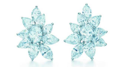
Tiffany & Co. 蒂芙尼 Victoria™ 系列铂金镶钻耳钉