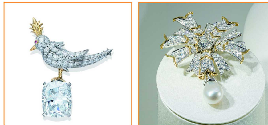
(左) Tiffany & Co. 蒂芙尼 Schlumberger™ 高级珠宝系列“石上鸟”胸针 (右) Tiffany & Co. 蒂芙尼 Schlumberger™ 高级珠宝系列 缎带造型胸针