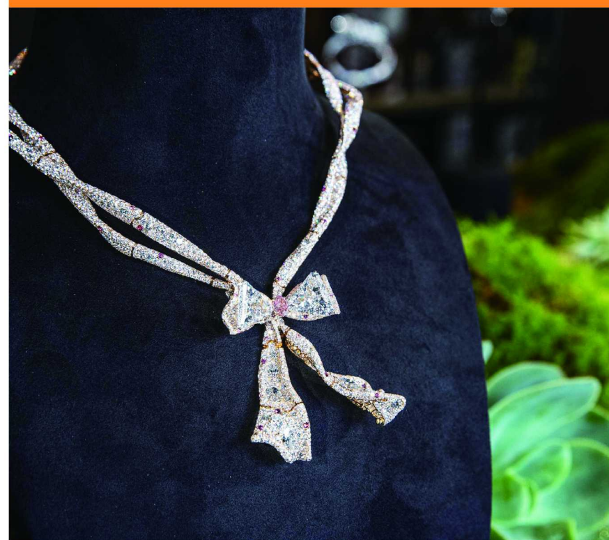
CINDY CHAO 浓彩粉钻缎带套链