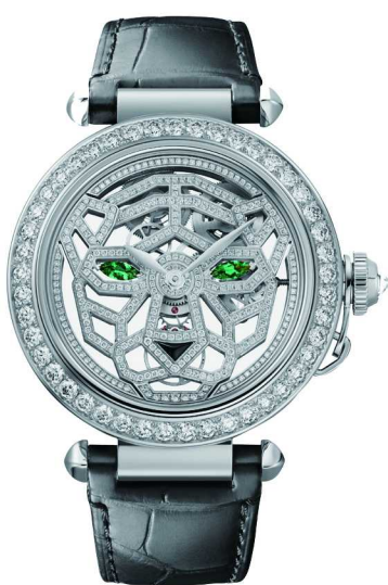
(上) Panthère de Cartier 卡地亚猎豹系列高级珠宝项链 (中) Panthère de Cartier 卡地亚猎豹系列高级珠宝胸针 (下) Pasha de Cartier 系列猎豹装饰腕表