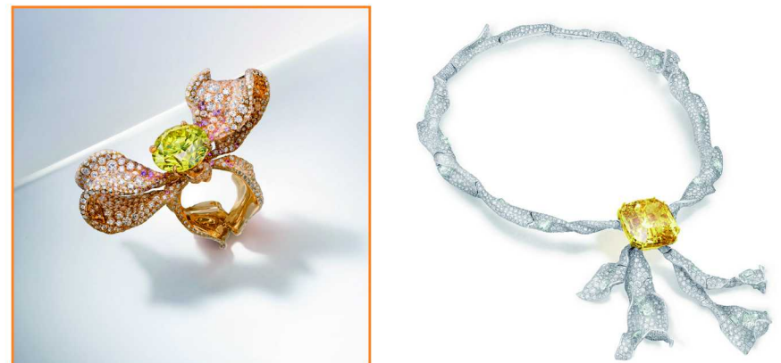
(左) CINDY CHAO 艳彩黄钻缎带戒指 (右) CINDY CHAO 88.88 克拉艳彩黄钻套链