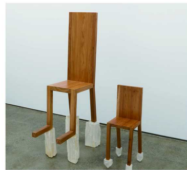
人用椅与灵用椅 (1), 2012 玛丽娜·阿布拉莫维奇

行为艺术先驱玛丽娜·阿布拉莫维奇 (Marina Abramovic) 将在上海带来她的个展。展览汇聚了她的《须臾之物》(Transitory Objects) 系列、记录1970年代行为艺术的摄影，以及一件影像装置。