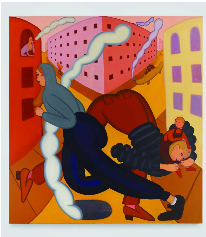
格蕾丝·韦弗，《十字路口》/余德耀基金会藏品群展“邻居 (Next Door)”

“五天的小长假近在眼前。如何找一个清净又有趣的地方，度过一段悠闲的假日时光？看一场展览，或许是一个不错的选择。这几场小众而特别的展览，推荐给你吧。”