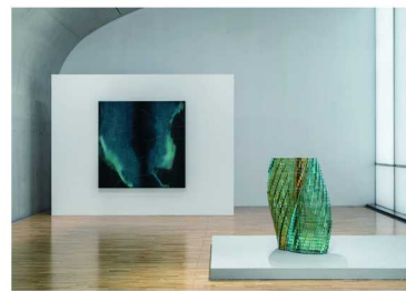
施拉泽·赫什阿里个展“根茎”

“根茎”是施拉泽·赫什阿里在中国的首次大型美术馆个展，汇集了赫什阿里近期的大幅绘画新作、组合式雕塑及一件大型沉浸式声音影像装置，探索哲学、宇宙、地理、物理及信仰相关的主题。