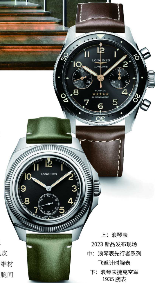
上：浪琴表 2023 新品发布现场 中：浪琴表先行者系列 飞返计时腕表 下：浪琴表捷克空军 1935 腕表

样的定制摆陀。这是先行者系列中首次采用这种设计，彰显该系列始终如一先锋精神。双向可旋转表圈采用彩色陶瓷材质，42 毫米精钢表壳搭配可替换的精钢表链、棕色皮革表带或蓝色织物表带，诠释了一种独有的优雅美学风格。