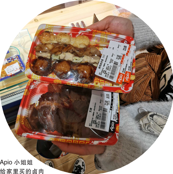
Apio 小姐姐 给家里买的卤肉 和烤鸡肉串

阿姨们“人肉”兜出来的信息,会令成天抱着手机,以为天下事尽在掌握的年轻人惊讶,但还有比阿姨有着更快一步信息优势的人。