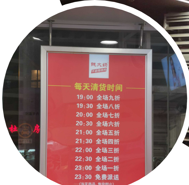
钱大妈 打折时刻表

说实话,11 点半的免费派送更像是一个噱头,别说阿姨爷叔们心有余力不足,熬不了这个夜,营业员们也吃不消啊。