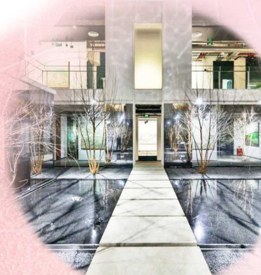
制图 / 潘文健