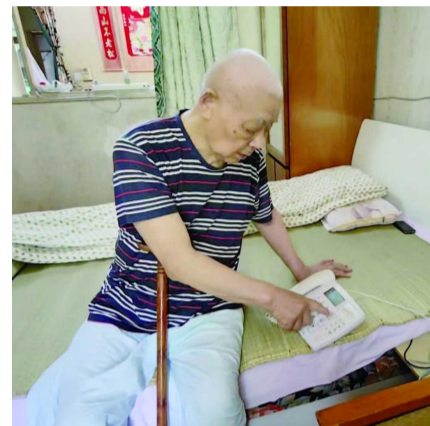
老人会选择把座机安装在床头