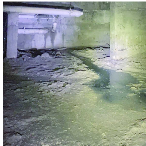
▲架空层内地面是十多年来腐烂的污泥 ▲屋内墙壁和贴脚线因潮湿而变色变形