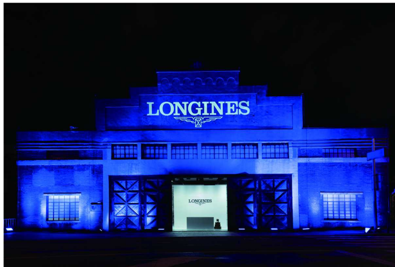
浪琴表揭幕全新飞返计时腕表