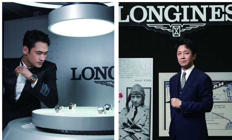
演员潘粤明 (右)、袁弘 (左) 佩戴浪琴表优雅亮相

瑞士高级钟表制造商江诗丹顿在上海 Maison 1755 时间艺术“家”顶层的“艺术空间”内，隆重揭幕了品牌的全新展览，以“卓尔不群：致力技艺传承”为主题，生动展现品牌传承和发扬专业技艺的深厚传统和里程丰碑。