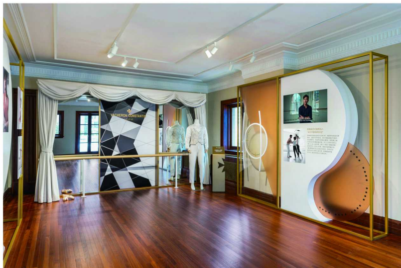
“One of Not Many 卓尔不群青年才俊”陈镇威芭蕾舞展区

全新浪琴表先行者系列飞返计时腕表，搭载专属抗磁机芯，内置硅游丝，可抵挡温度、气压等外界环境对表款走时的影响，凭借精准的走时，系列表款获瑞士官方天文台认证 (COSC)，动力储备可达约68小时；表款采用缎纹、亚光、抛光与雕饰等多重工艺，精致细节搭配利落动感的线条，勾勒现代优雅风格。