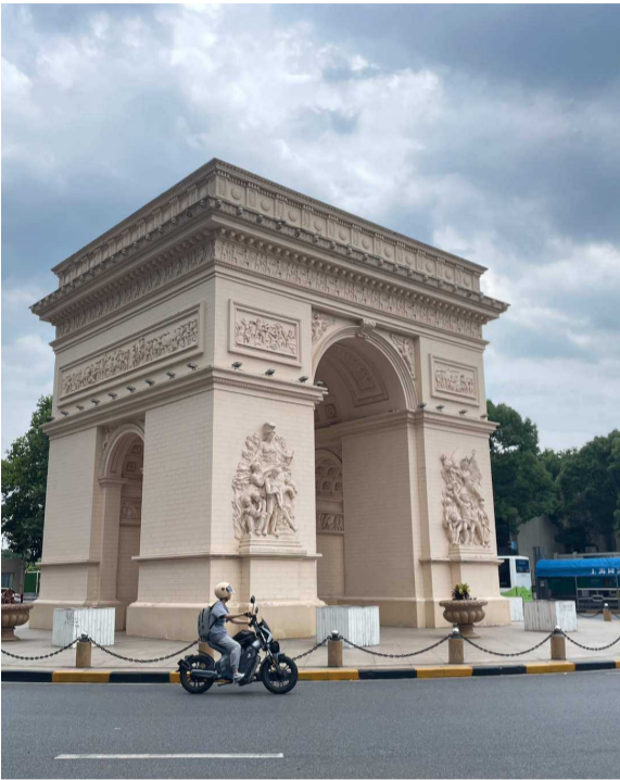
上海康城南门的凱旋門

我们通过实地走访和 20 年前的报纸资料对比,带大家看看 21 世纪上海欧式建筑。