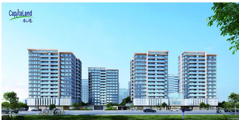
凯德·璟高府效果图

凯德·璟高府总建筑面积约8.9万平方米，绿地率高达35%，规划11幢14层的小高层，总户数471套，户型面积约106-169平方米。该项目是杭州金沙湖板块难得一见的紧靠地铁、“双天街”（吾角天街、金沙天街）环伺的高品质改善型住宅。