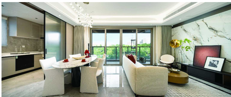
样板间实拍图带软装 建面约135㎡样 风格示意

此次凯德·璟高府的推出，将以精心择址、国际精工、以人为本、绿色生态的高品质产品，继续在杭州市场引领人居新标准，助力当地人居品质升级。未来，凯德将继续秉持以客户为中心，以融合国际化理念和本地经验的专业能力，服务于城市发展和生活品质升级。（孙鑫） 杭售许字(2023)第003025号