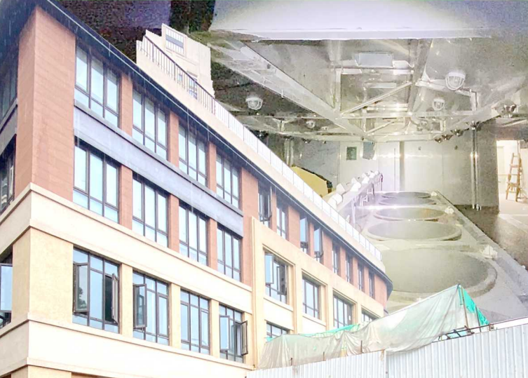
制图 / 潘文健