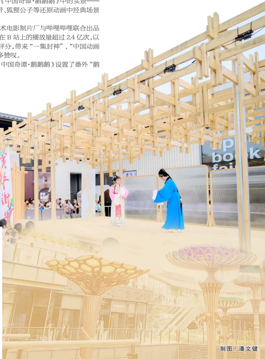
制图 / 潘文健