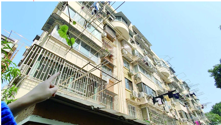
原本的马赛克墙面被涂料覆盖

徐汇区房管局一名工作人员则表示:“我们还在努力跟街道和居民做工作,也借此机会主动向前,和居民沟通。”