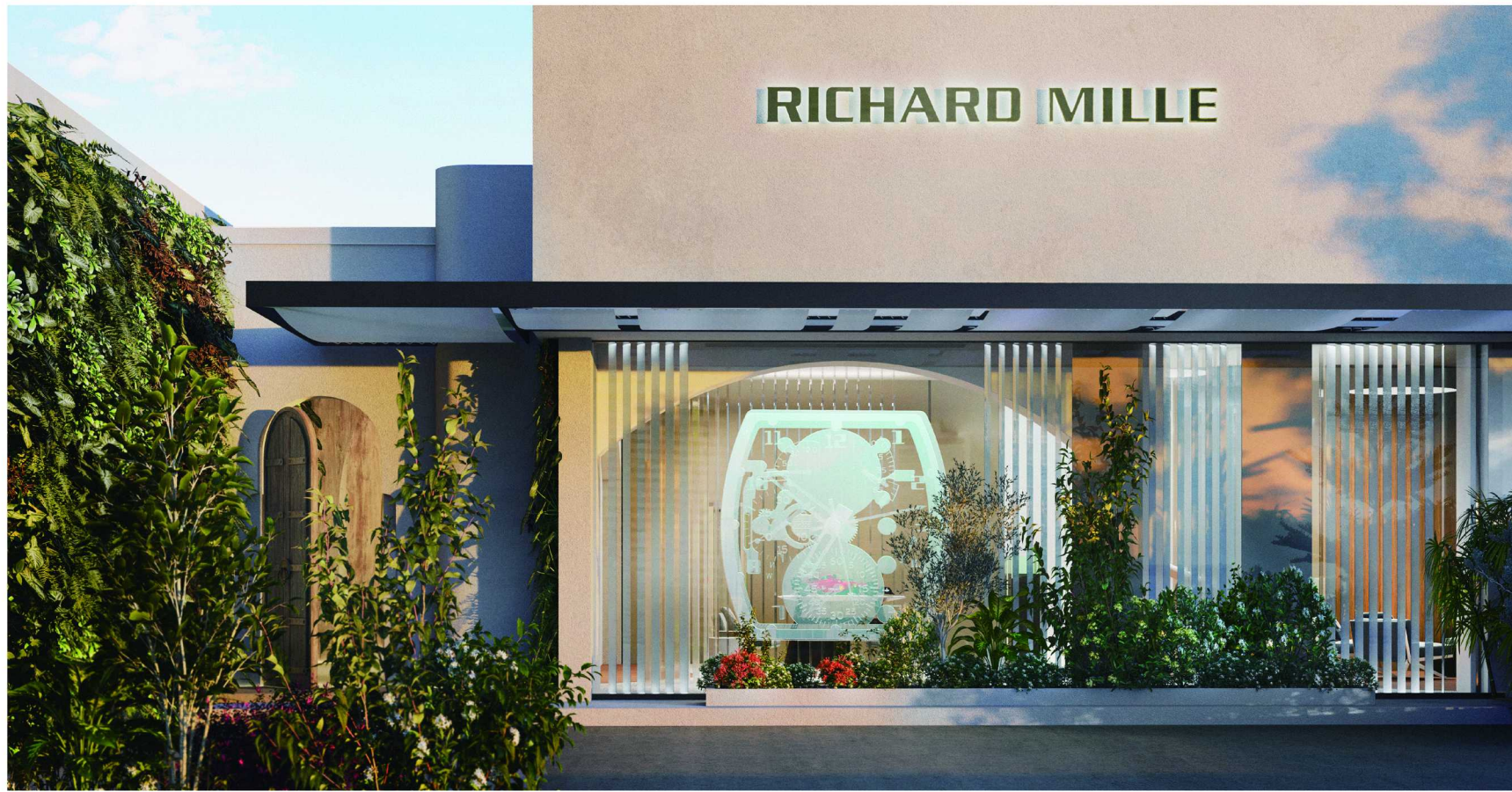
RICHARD MILLE St. Martin 概念旗舰店外观