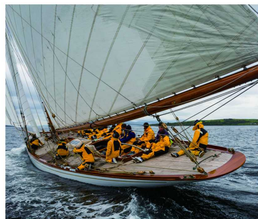
RICHARD MILLE 杯经典帆船赛