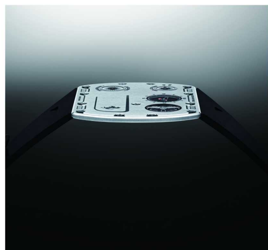
RM UP-01 Ferrari 腕表