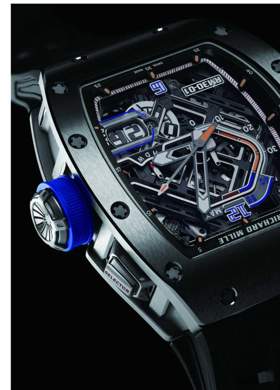
RM 30-01 离合摆陀自动上链腕表