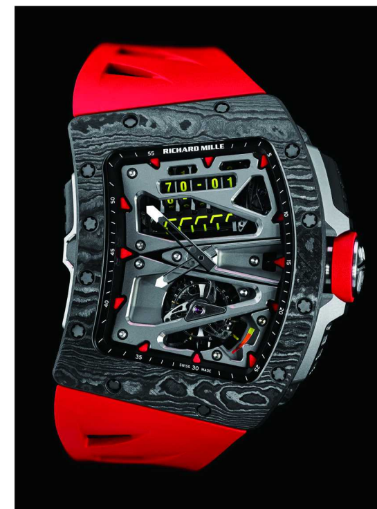
RM 70-01 陀飞轮腕表