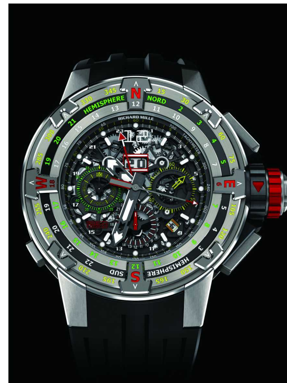
RM 60-01 Regatta 自动上链飞返计时码表