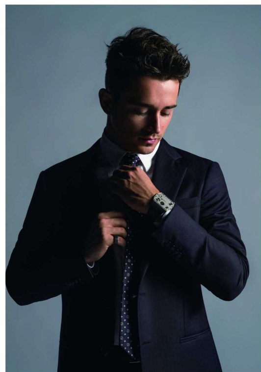
品牌挚友、法拉利 F1 车手夏尔·勒克莱尔 (Charles Leclerc)