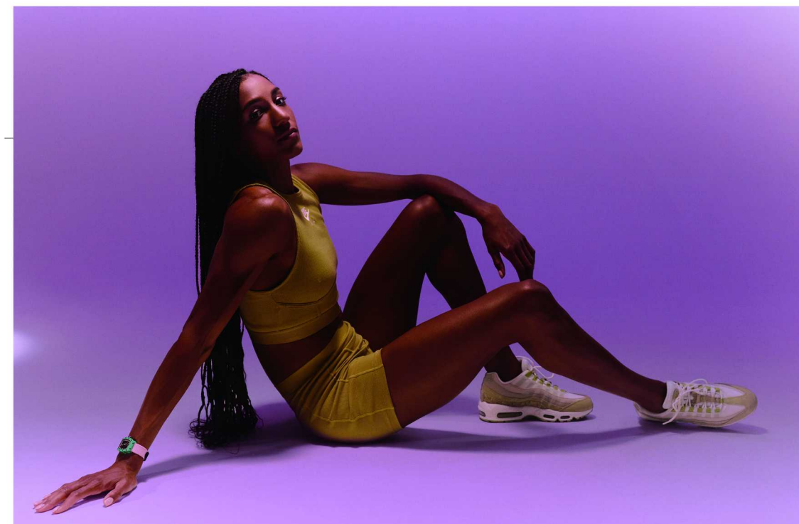
RM 07-04 运动型女士表

表款从外观到功能都不断地突破既有的经典，人则不断突破个人能力的极限达到新的境界，人表合一的状态就是 RICHARD MILLE 追求的完美状态。当然，从现代制表业的发展角度看，RICHARD MILLE 更是一个破局者，引导着行业潮流不断地沿着实用化与创新探索前行，它也使得制表这一古老的行业显得更加生机勃勃，充满活力。