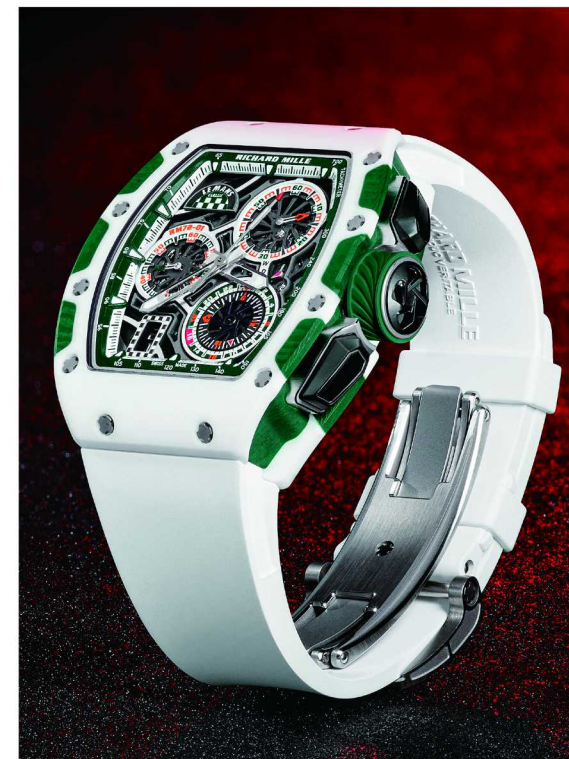
呈现致敬 2023 年赛事的 RM 72-01 Le Mans Classic

RICHARD MILLE 总是能够在推新产品的同时，满足其买家内心的某些特殊需求，这让为数众多的品牌爱好者心怀期待，迫切希望看到下一款甚合己意的新产品。