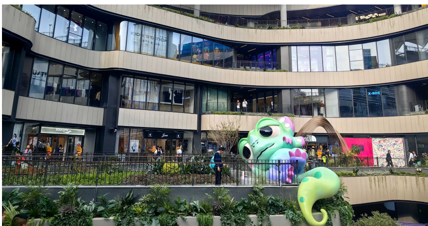
百联西郊购物中心

百货超市变身生活中心,吃饭、遛娃、购物、装修等一站式搞定,还引入特色市集,焕新后的生活中心满足更多生活需求,也更有烟火气;20年老牌商场重新回归,海岛风的用餐环境、随处可见的绿境自然风满满,周边居民来喝喝咖啡,逛逛街,顺便遛狗、遛猫、遛鸟;在备受关注的前滩新增一站式生活目的地,有大型综合文化艺术中心、文娱商业空间、写字楼以及精品酒店,接下来,还将上演陶喆上海专场、百老汇原版音乐剧、迪士尼奇幻世界演唱会等演出……随着上海城市更新跑出“加速度”,小到家门口的去处,大到放眼全国都颇具影响力的超大商业综合体,上海新增的好去处真不少!