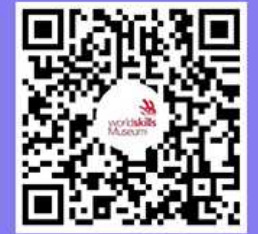
文/余柯 晨报记者 顾文俊

4、预约通道 通道1:关注“世界技能博物馆”官方微信公众号,点击菜单栏【GO技博-参观预约】;或向微信公众号发送关键词“预约”,获取预约链接。 通道2:登陆世界技能博物馆官网( https://www.worldskillsmuseum.cn/ ),点击【参观预约】,按需选择“个人预约”或“团体预约”。 通道3:识别二维码进入世界技能博物馆小程序,点击“参观预约”。