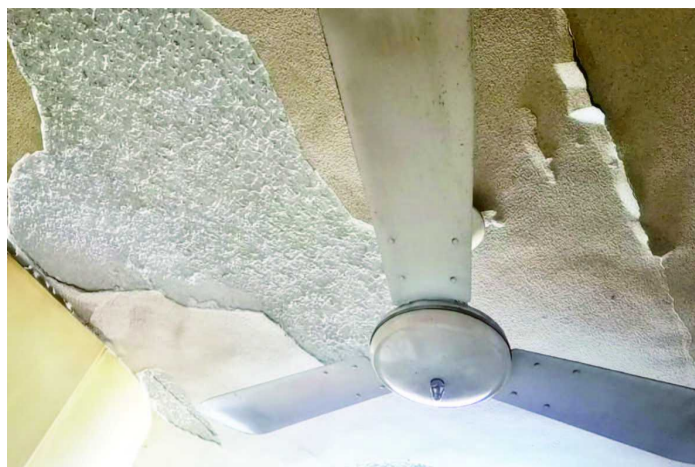
天花板的涂料层,也开始陆续脱落