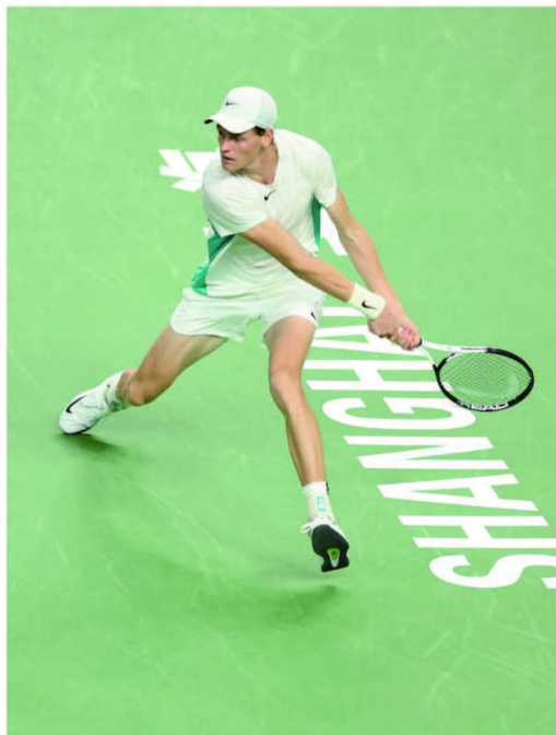
2023年上海劳力士大师赛上，劳力士代言人詹尼克·辛纳准备反手击球

精英球员与网坛新星们在赛场展现不凡实力，贡献出一场场精彩纷呈的对决。这其中便包括劳力士代言人卡洛斯·阿尔卡拉斯（Carlos Alcaraz）、詹尼克·辛纳（Jannik Sinner）、霍尔格·鲁内（Holger Rune）、泰勒·弗里茨（Taylor Fritz）和洛伦佐·穆塞蒂（Lorenzo Musetti）。