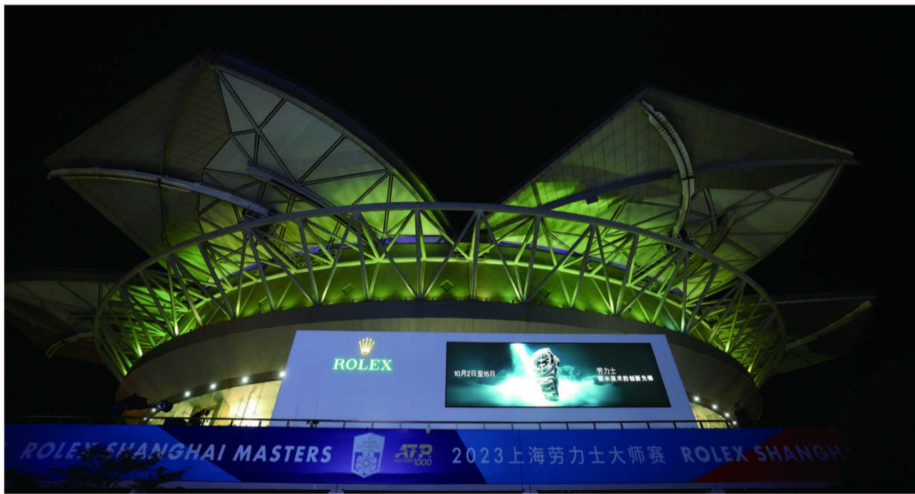
2023年上海劳力士大师赛期间上海旗忠森林体育城网球中心全景

2023年10月15日，上海劳力士大师赛（Rolex Shanghai Masters）结束为期两周的激烈比拼，于旗忠森林体育城网球中心（Qizhong Forest Sports City Arena）圆满落幕。作为唯一在欧洲和北美以外地区举办的国际男子职业网球联合会（Association of Tennis Professionals, ATP）1000大师赛，上海劳力士大师赛被公认为亚洲地区首屈一指的网球赛事。