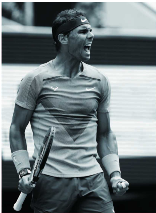
品牌挚友拉菲尔·纳达尔 (Rafael Nadal)