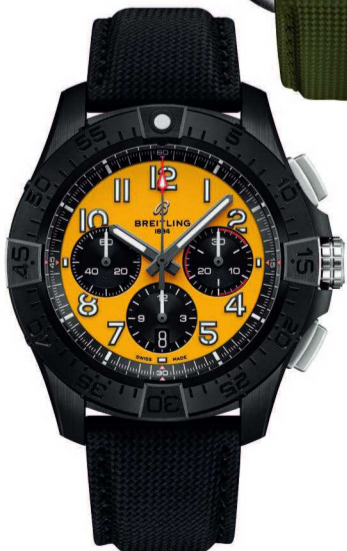
百年灵复仇者系列 B01 计时码表 44 夜间任务版 黄色表盘 - 黑色皮革表带

人类与航空的联系源远流长。自人类探索飞行以来，航空技术的进步不仅改变了人们的交通方式，更深刻地影响了社会发展和全球化。航空工程的创新不仅仅是科技的进步，更是对人类勇气、探索精神和创造力的象征。