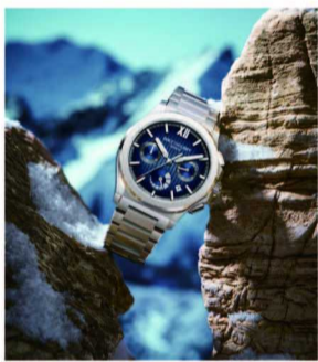
艾米龙冰峰系列腕表