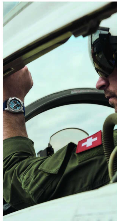
百年灵复仇者系列 B01 计时码表 44 蓝色皮革表带

全新复仇者 B01 计时码表搭载百年灵自制 01 机芯，提供约 70 小时的动力储存。计时码表配备了镂空蓝宝石水晶玻璃表底，表壳和表圈由防刮陶瓷制作而成，其表底、表冠、计时按钮和表扣均由钛金属制成，兼顾了轻盈与坚固。复仇者 GMT 自动机械腕表 44 采用 24 小时旋转表圈，红色 GMT 指针可一目了然读取格林威治平均时，其直径与之前提到的计时码表相同，但外形更为紧凑。腕表提供约 42 小时的动力储存。复仇者自动机械腕表 42 采用精钢制作而成，搭载百年灵 17 自动三针机芯，可提供可达约 38 小时的动力储存。