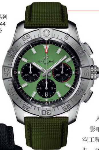
百年灵复仇者系列 B01 计时码表 44 绿色皮革表带

自2020年以来，艾米龙联合中国科学院西北生态环境资源研究院以及达古冰川管理局，在达古冰川景区持续开展冰川保护工作，未来还将继续支持更多全球范围内的冰川保护科研团队。冰川不仅是冷峻圣洁的自然风光，更是人与自然和谐共生的重要象征。艾米龙品牌呼吁每一个人关注冰川变化，共同维护地球生态平衡，让冰川景观得以长久澄澈明净。