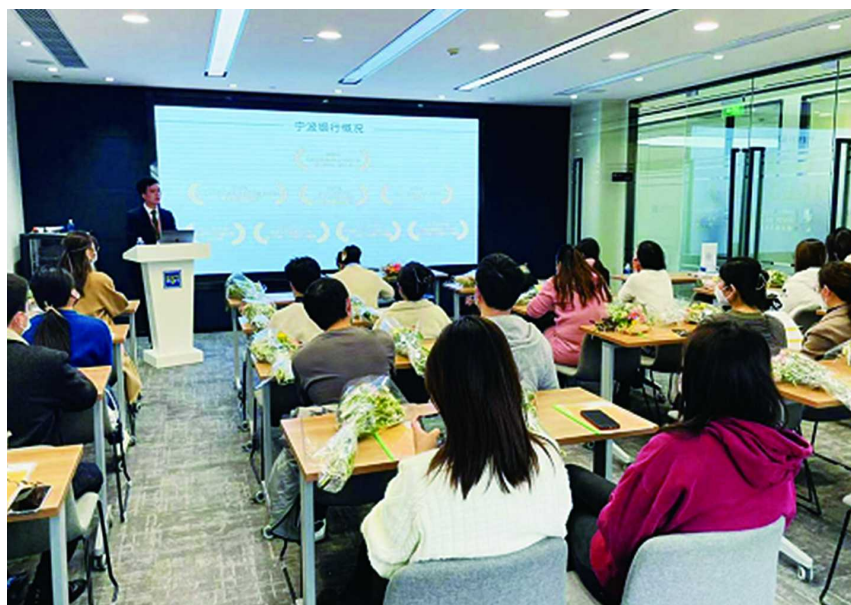
宁波银行上海分行走进企业开展《个人养老金政策解读》投资策略报告会

一是设置养老金专区,创新适老金融服务。作为个人养老金业务的首批试点银行,宁波银行充分发挥金融科技优势,全力推进系