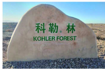
第 12 座“科勒林”项目于甘肃省民勤县正式启动

早在 2010 年，科勒与中国青少年发展基金会携手发起“共建科勒林，感恩母亲河”项目，并将 150 万棵树设定为该项目的总目标，以此长期行动号召人们关注地球环境，助力守护两河流域的生态环境，通过增加森林面积助力碳中和。截至 2023 年底，河北衡水、陕西榆林等多个省市已建设了 12 座科勒林，总计植树约 50 万棵。