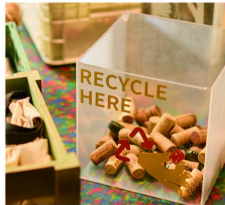
DENTREE 向大众收集生活中鲜少用上的帆布袋及废弃的酒瓶软木塞并留下物尽其用的故事

DENTREE 倡导的是让可持续的生活方式渗透进生活中，以“物尽其用”的视角出发，着眼于身边场景及日常材料，用心做好点滴小事。