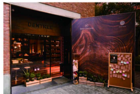
DENTREE 携手好瓶 共创“好故事换好酒”好物改造工作坊

“宝藏小屋”项目此前已累计惠及超过 17 万名处境不利的流动儿童。目前，瑞士美度表慈善公益活动所支持的宝藏小屋静安项目点在 150 平方米的空间内设三个琴房、两个活动室，服务社区内三百余名儿童。瑞士美度表所捐善款将覆盖该项目点为期一年的运营费用，包括聘请专业人员为注册流动儿童开展各类活动，并为项目点全职执行人员提供工资、培训等。在这里，孩子们不仅收获友好的伙伴关系，更能够在帮助下发掘自身潜力，开启成长的更多可能。瑞士美度表也将持续关注宝藏小屋静安项目点的运营情况，并动员鼓励企业员工一同参与志愿服务，为孩子们带去更多关怀与陪伴。