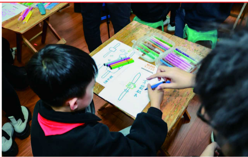
2023年瑞士美度表慈善公益活动现场