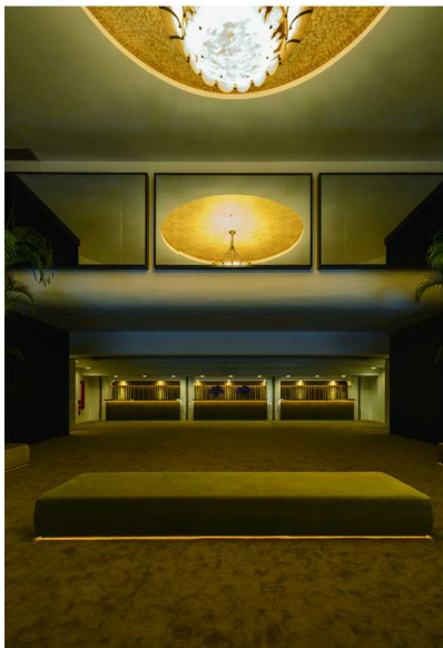
衡山电影院派对现场