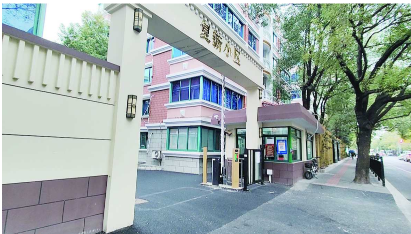
复新小区现将甘溪路门作为正门