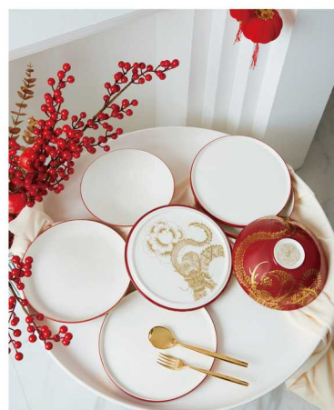
德国唯宝拉布尔球·祥云腾龙限定礼盒

限定款拉布尔球·祥云腾龙从中华传统文化元素中汲取灵感，融合康定斯基抽象艺术，在历经 1200 度高温烧制后，鎏金祥龙跃然而出。7 件餐瓷巧妙地体现了拉布尔球器型独特的设计。融合中西美学的拉布尔球·祥云腾龙全球限量发售 98 件，尽显新年团圆和乐之美。