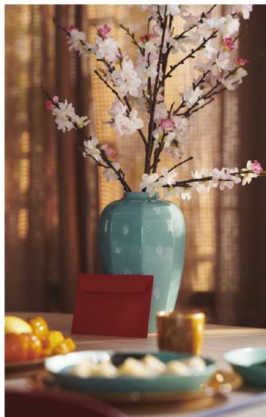
宜家 FÖSSTA 弗斯达花瓶

该系列共有 30 款简约别致的餐具套组、年味浓郁的装饰品、家纺及家居配件等。而且，整个系列中还有多件价格低于 30 元的产品，是非常高性价比的新年家居选择。氛围，体验轻松、可负担的理想家居生活。