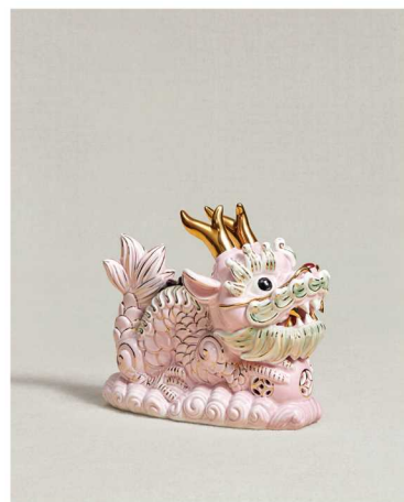
喜行乐 x Zara 甲辰龙联名系列家居摆件

这条“小粉龙”出现在了这一系列的众多产品设计中，包括茶壶、瓷盘、水杯、筷架等，与经典的寿桃、松树、金鱼、蝴蝶等图案相互呼应。在产品整体配色上，喜行乐也大胆采用了源自于中国绘画渲染的色彩组合，展现了属于新生代独有视角下的中式潮流，织绘成复古而摩登的家居氛围。