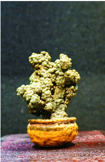
内蒙古戈壁石“唐三彩盆景”