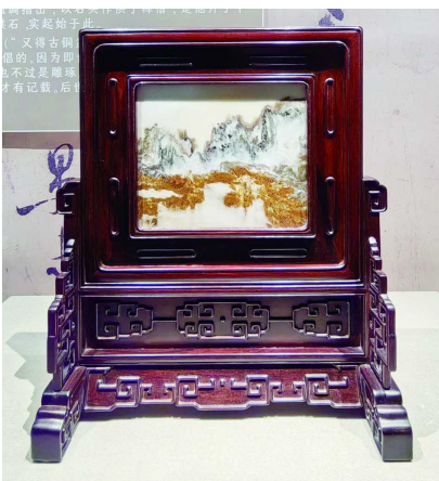
大理石“金沙红晨晖”