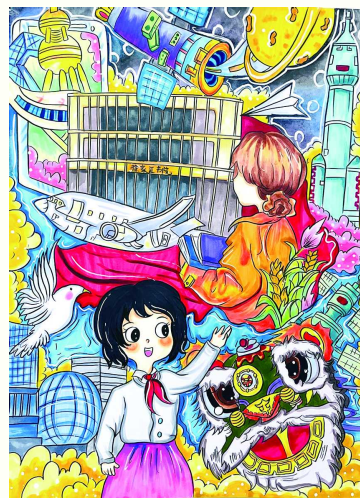
《梦想·未来》 潘玥霖 徐汇区上海小学 四年级