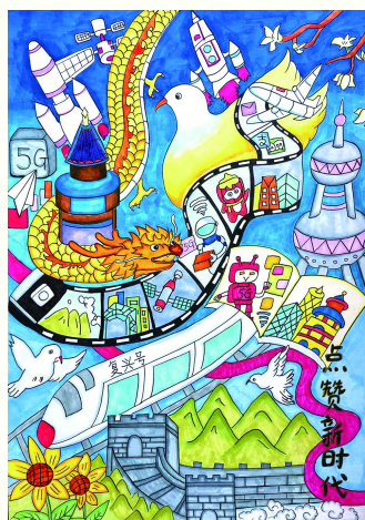
《点赞新时代》 冯慕溪 普陀区武宁路小学 二年级