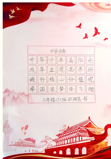
《中华少年》 邵梓辰 黄浦区卢湾一中心小学 二年级