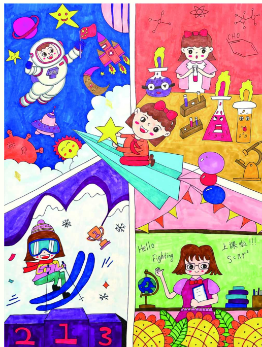
《新时代新征程强国有我》 张爱薇 虹口区复兴实验小学 四年级