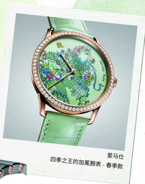
爱马仕 四季之王的加冕腕表 - 春季款