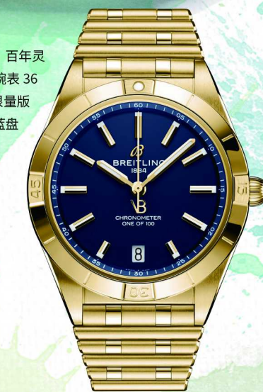
百年灵 机械计时自动机械腕表 36 维多利亚·贝克汉姆限量版 18K 黄金款 - 午夜蓝盘