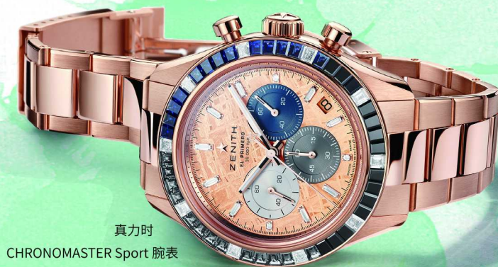
真力时 CHRONOMASTER Sport 腕表

欧米茄星座系列腕表续写新篇，全新陨石盘面腕表的表盘采用瑞典 Muonionalusta 铁陨石打造而成，这种陨石是地球上目前发现的古老陨石之一，具有天然纹理，这也使得每一枚陨石表盘拥有独特个性。欧米茄采用前沿的色彩处理技术，共推出 20 个款式，涵盖 4 种表壳尺寸和不同色彩。其中星座系列陨石盘面腕表 25 毫米款，表壳由精钢和 Sedna 18K 金打造而成，陨石表盘经色彩工艺处理呈现丁香紫色，搭配镶钻表圈和钻石小时刻度，表背饰有星座腕表标志性的天文台徽章。