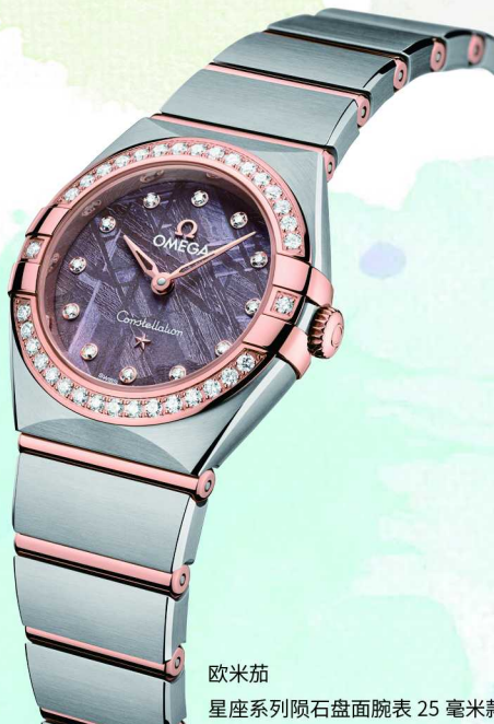
欧米茄 星座系列陨石盘面腕表 25 毫米款