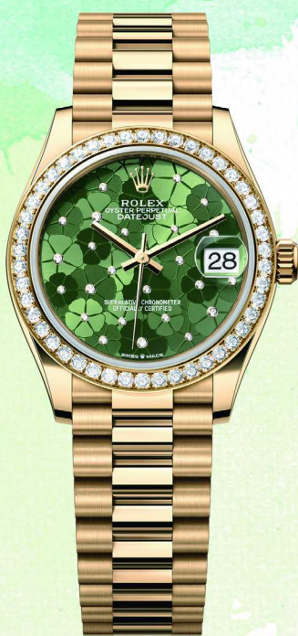
劳力士 蚝式恒动日志型 31 腕表 ©Rolex