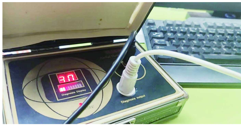
量子共振磁分析仪