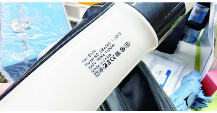
文/晨报记者 姚沁艺 晨报记者 姚沁艺

台形状酷似吹风机的装置。该机器共有两个挡位，可调风力大小，和普通吹风机的区别，可能就在于风筒处能照出蓝色的光点。