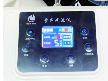
仪器给公猫开出的药方

体感上，四种模式并无区别，而且除了手柄上透出的灯光可以在蓝、黄、红、绿四种颜色中切换以外，该“量子光波仪”从使用感上，和普通的震动按摩仪器没什么不同。