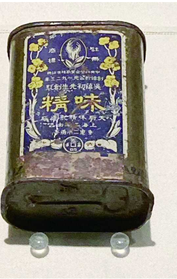
天厨味精制造厂的味精盒