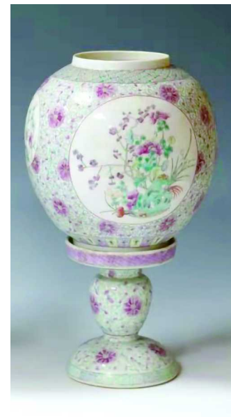
清·粉彩开光花卉纹瓷宫灯