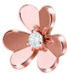
梵克雅宝 Frivole 吊坠 小号款式, 玫瑰金、钻石