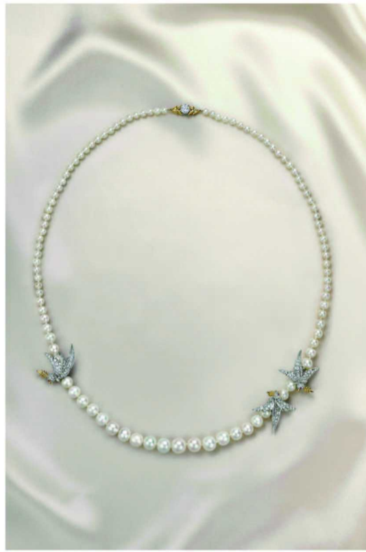
蒂芙尼让·史隆伯杰高级珠宝系列 铂金及 18K 黄金镶嵌白色与淡奶油色圆形、近圆形天然野生珍珠，钻石及红宝石 Bird on a Pearl 项链