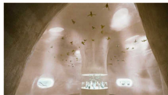
蒂芙尼于上海呈献让·史隆伯杰高级珠宝系列 Bird on a Pearl 作品