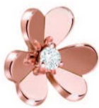
梵克雅宝 Frivole 耳环 小号款式, 玫瑰金、钻石

其中, Frivole 系列的娇美花蕾仿若盛放于白 K 金 7 花手镯之上,鲜明的线条勾勒婉约美态,近 300 颗美钻剔透闪耀,不对称设计配合微拱的心形花瓣,充满灵动之美。此外, Frivole 系列首次将玫瑰金、白 K 金和美钻交织,通过 8 花戒指谱写了一阙春之颂。三朵白 K 金花蕾密镶美钻,与五朵中央镶嵌一颗宝石的玫瑰金花朵,组成错落有致的层次。镜面抛光为玫瑰金