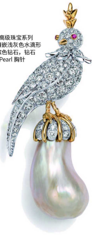
蒂芙尼让·史隆伯杰高级珠宝系列 18K 玫瑰金及铂金镶嵌浅灰色水滴形天然野生珍珠，香槟色钻石，钻石及红宝石 Bird on a Pearl 胸针