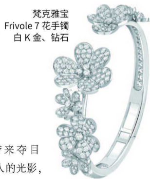
梵克雅宝 Frivole 7 花手镯 白 K 金、钻石