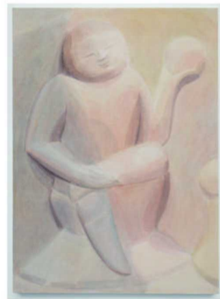
石至莹《童子的微笑3》 2023年，布面油画，180x130cm 致谢艺术家与空白空间

间向外放射散落的座椅，如同阵阵涟漪。你可以从任何一幅画开始，从任何一块石头进入，缓缓感受石至莹的绘画之道和本次展览的化城之法。