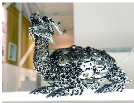
蝾螈 装置(金属)74x38x40cm 2019