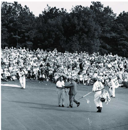
劳力士代言人阿诺德·帕尔默庆祝赢得1964年美国大师赛冠军

本届大师赛上，劳力士代言人泰格·伍兹同样表现亮眼，创下了美国大师赛连续24次晋级决赛圈的历史纪录。