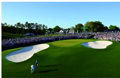
劳力士代言人斯科蒂·舍夫勒2022年在奥古斯塔国家高尔夫球俱乐部第18洞走向胜利

经过四天的挥杆角逐，劳力士代言人、目前男子高尔夫球世界排名第一的斯科蒂·舍夫勒（Scottie Scheffler）以总成绩277杆、低于标准杆11杆的优异表现夺冠，这也是他继2022年赢得该赛事冠军后，三年内第二次举起美国大师赛冠军奖杯。