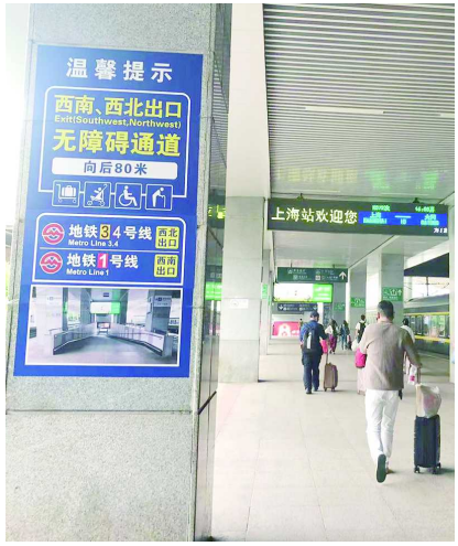
西北、西南出口是一个大斜坡,对携带较多行李箱的旅客比较方便。