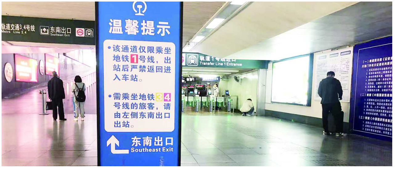
走上海站东南出口可以免二次安检换乘地铁 1 号线

另外一个问题是,如果旅客买到的座位是靠近西北、西南出口,但又不想麻烦再次安检,需要从火车一头走到另一头的东北、东南出口。从记者昨天的现场体验来看,新开的火车站东北出口通行速度较快,旅客可以很快去乘坐地铁 3、4 号线,而西北出口外的地铁 3、4 号线闸机除了接待火车旅客外,还有从其他口进站乘坐地铁的人,时常需要安检排