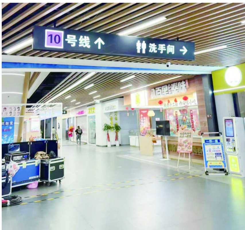
商场内的地铁 10 号线指示牌是物业制作安装的

同时,记者还向 12345 市民热线咨询得知,商场内安装的指示牌是商场自身的行为,并不在相关职能部门的监管范围内。