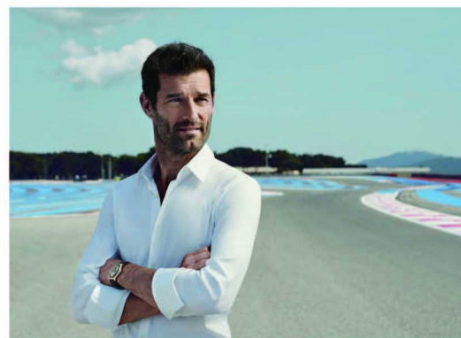
劳力士代言人马克·韦伯（Mark Webber）

在2024年国际汽联世界一级方程式锦标赛中（2024 FIA Formula One World Championship™），劳力士与一级方程式锦标赛延续双方的传奇合作历程。本赛季一级方程式锦标赛是迄今为止规模最大的赛事，各个车队将展开24场激烈角逐，赛道遍布五大洲。劳力士维修道时钟（Rolex Pit Lane Clock）坚守于每场大奖赛现场，作为精准计时的象征与追求卓越的见证。赛事秉持悠久传承与未来承诺，将继续开发更加安全高效的技术，并计划于2026年推行百分百可持续燃料，力求到2030年前实现净零碳足迹。劳力士与一级方程式锦标赛拥抱悠久历史、秉承先锋理念，矢志不懈地为当代与后辈开拓创新。