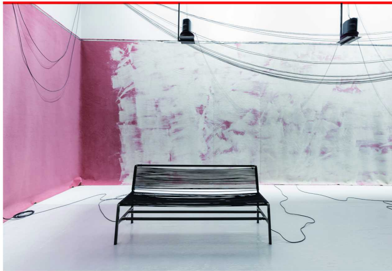
“清醒梦境：声音的旅程”展览现场