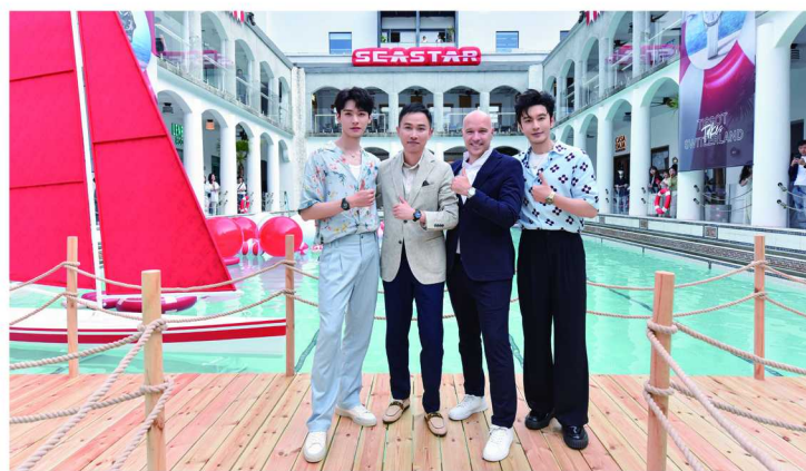
瑞士天梭表于上海举办 2024 天梭海星系列新品发布会

天梭全球代言人，他们不仅分享了海星系列新品的佩戴感受和对产品理念的思考，也鼓励大家“破浪而行”，努力突破舒适圈，勇敢地拥抱夏天。