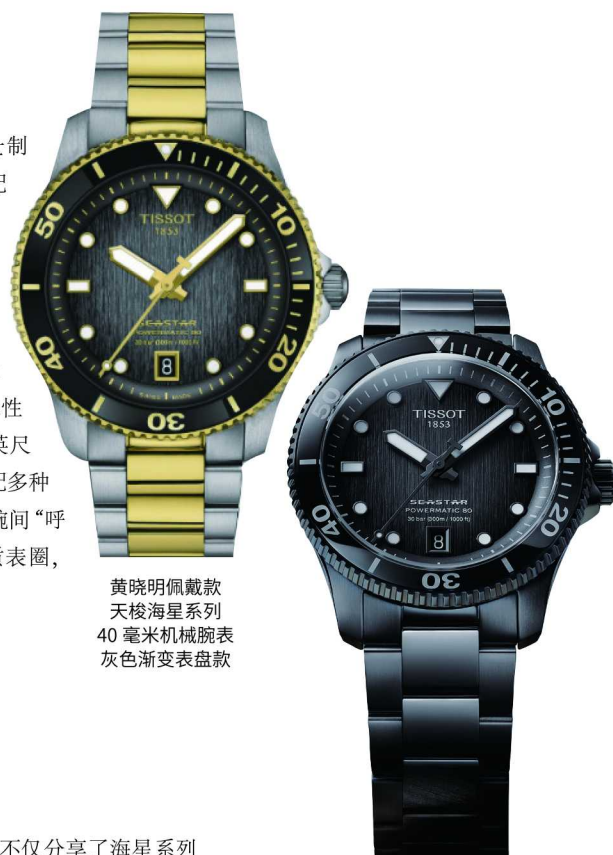
黄晓明佩戴款 天梭海星系列 40 毫米机械腕表 灰色渐变表盘款

观时尚动感，搭载瑞士制造机械动力 80 机芯，配合 Nivachron 游丝动力储存可达 80 小时；指针和时标涂覆 Super-LumiNova 夜光涂层，确保在极端情况下依旧可以清晰读时；防水性能可抵御相当于 1000 英尺（300 米）的压力；搭配多种腕表配色，独特个性在腕间“呼之欲出”；彩色矿物质表圈，更显个性。